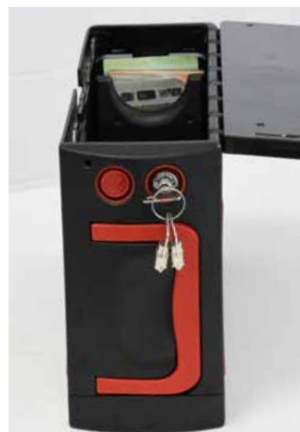
Recaudación de billetes en un módulo cerrado. Nadie ve ni toca el dinero

CASHKEEPER ® closed and secure cash handling