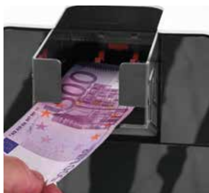
Acepta y verifica todos los billetes, incluyendo el de 500 €