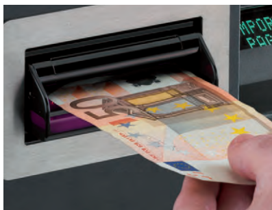
Tous les billets acceptés sont authentiques.