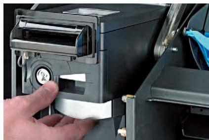
Mécanisme pour le déblocage de la cassette