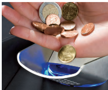
Accepte et vérifie 3 pièces par seconde.