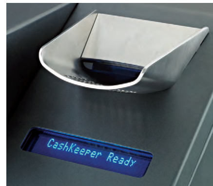
Viseur intégré à haute luminosité