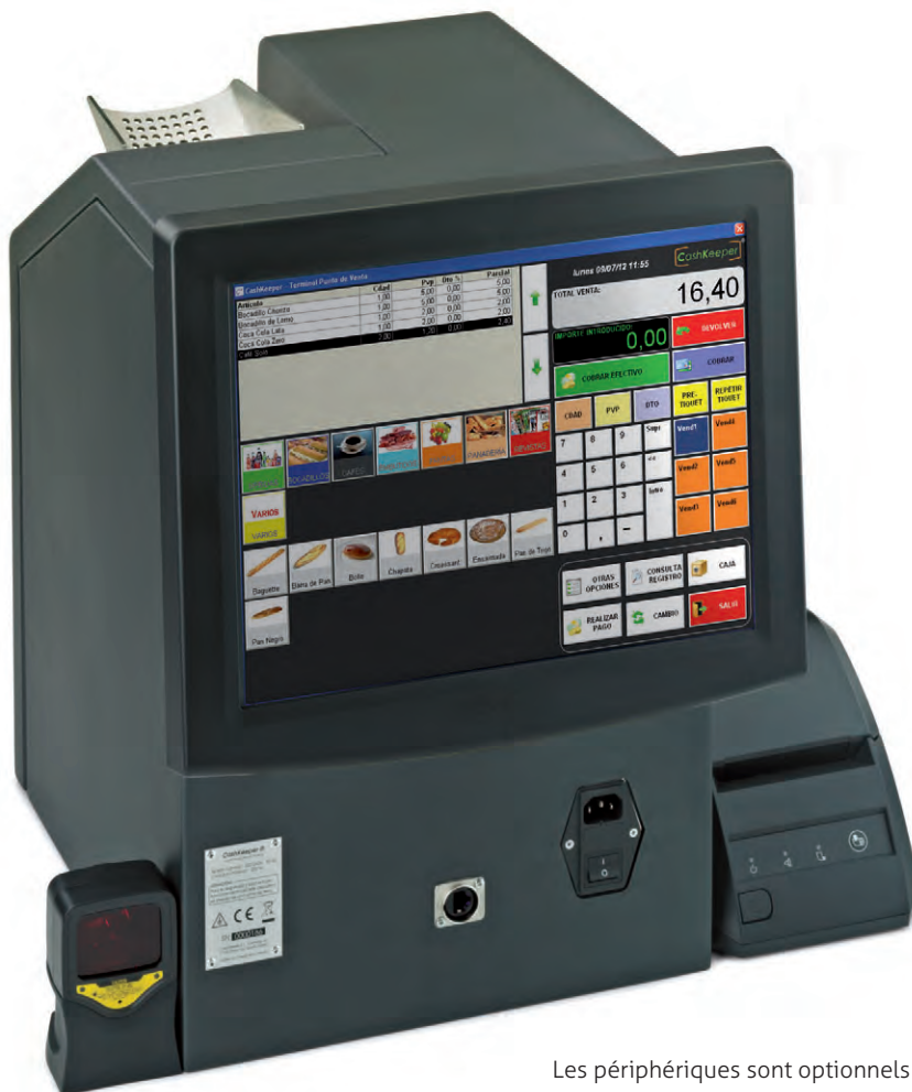
Les périphériques sont optionnels