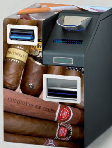
Aimants pour la publicité