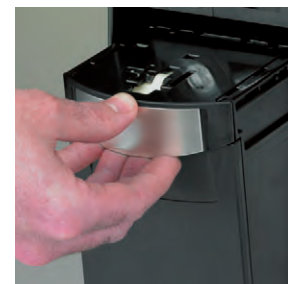
Extraction de la cassette